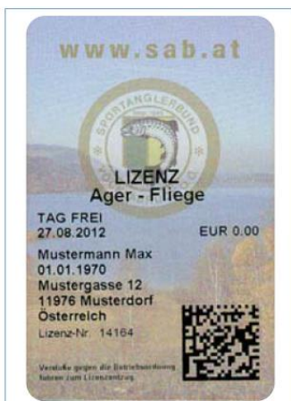
Lizenzkarte des SAB