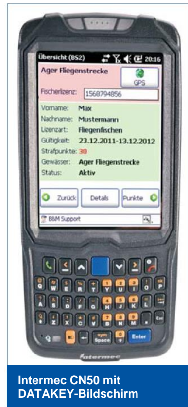
Intermec CN50 mit DATAKEY-Bildschirm

mit 3.75G Wireless-WAN und WiFi-zertifizierten IEEE 802.11-Funkmodul erlauben den schnellen Datenaustausch, eine sichere Sprachkommunikation und ermöglichen die Speicherung der GPS-Koordinaten jedes Kontrollpunktes am Server.