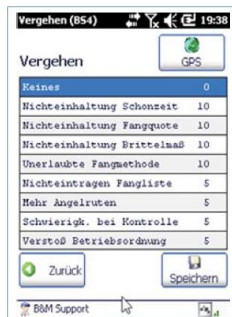
Strafpunkte am CN50

Um gesetztes- und umweltkonform fischen zu dürfen, bedarf es einer amtlichen Fischerkarte, eines Lizenzbuches und pro Fischgewässer einer Lizenz. Die Lizenz ist die Fischereiberechtigung laut Betriebsordnung für ein bestimmtes Gewässer für eine begrenzte Zeit. Außerdem muss jeder Fischer eine Fangliste führen, wo jeder ent-