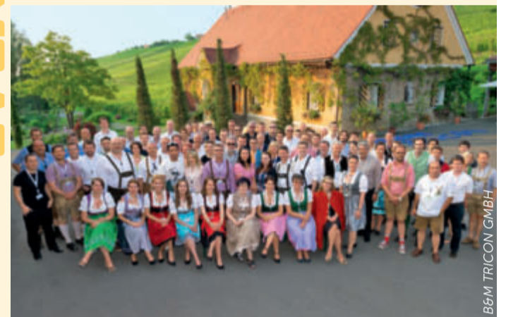
B&M TRICON GMBH